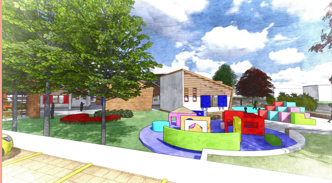
Imagem 82: Perspectiva do brinquedo

O pátio lateral descoberto corresponde uma área de xxxxxx e apresenta uma série de espaços desafiadores. A proposta apresentada, sugere que o pequeno espaço de lazer não se configurasse como um conjunto de "brinquedos" tradicionais, mas que a própria arquitetura se apresentasse como um conjunto de objetos lúdicos, a ser apropriado, vivenciado e utilizado conforme a criatividade das crianças. De acordo com a NBR 16071/2012 - Playgrounds, os brinquedos devem ser resistentes ao fogo e apresentarem resistência à corrosão, por isso todos os brinquedos do CEI são de aço.